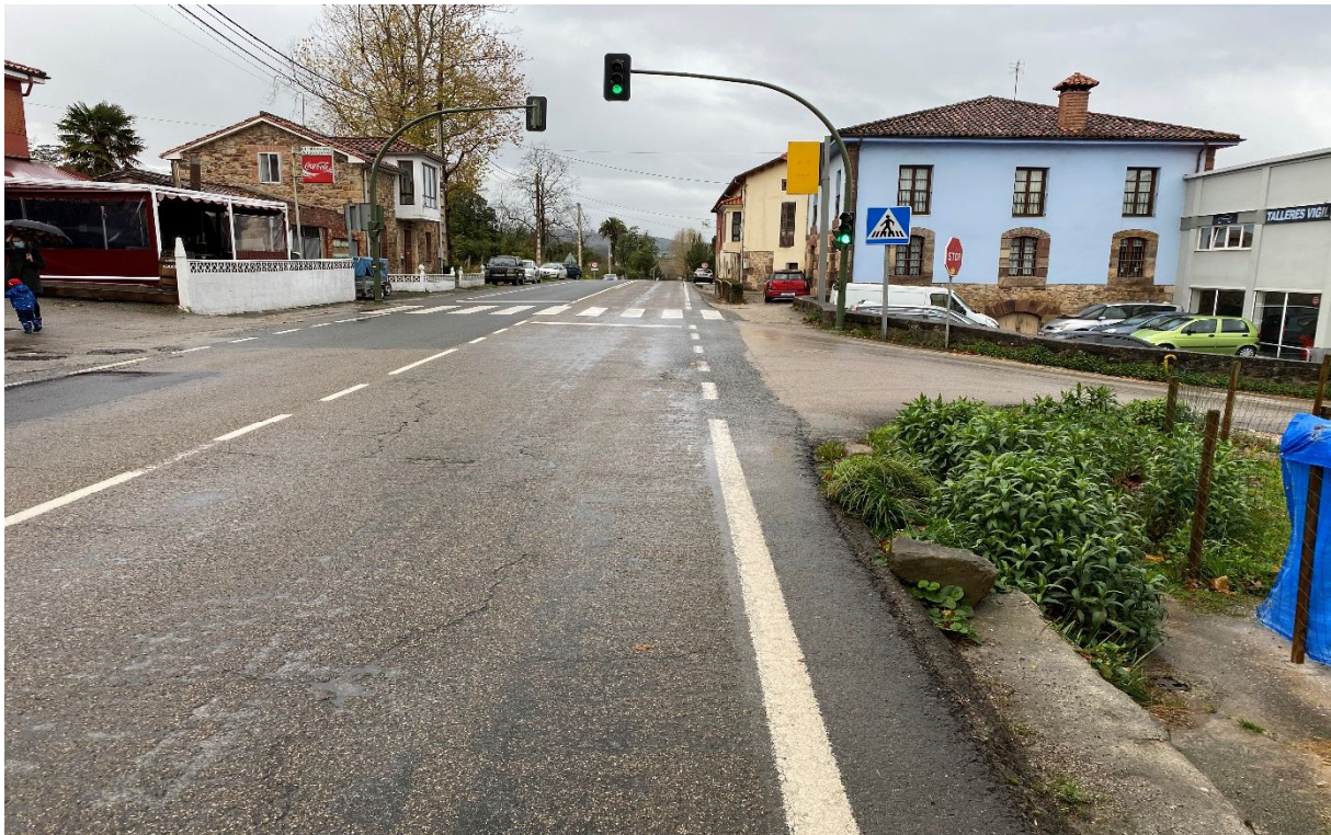
(Cruce de la Picota en Renedo , la N-623 enlaza con Barrio Llosacampo)